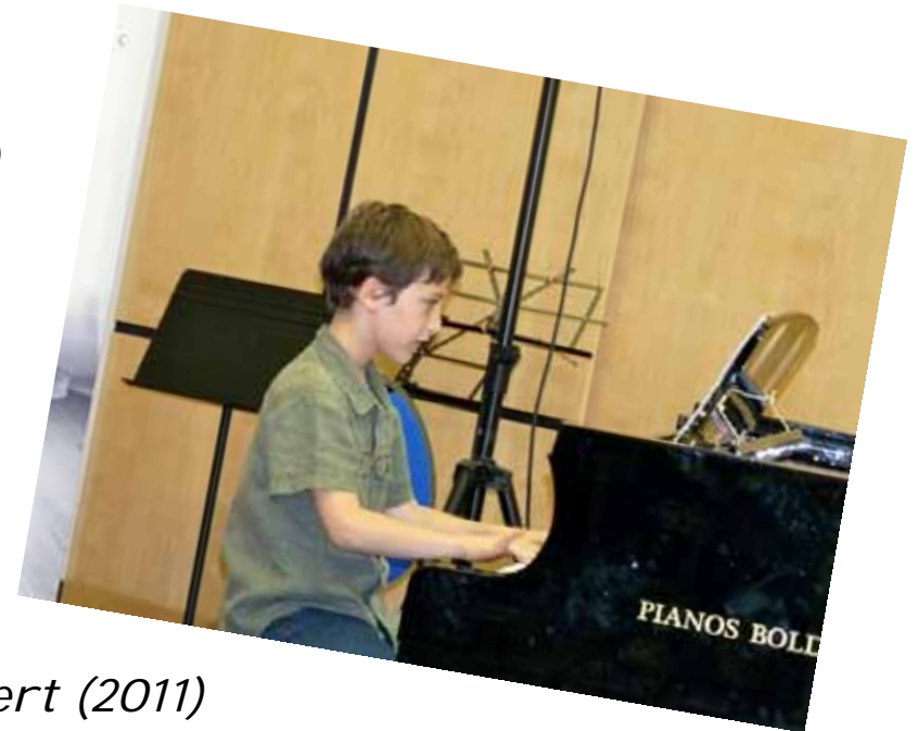
Yohan en concert (2011)