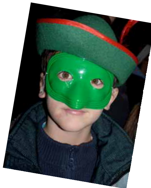
Le Yohan masqué