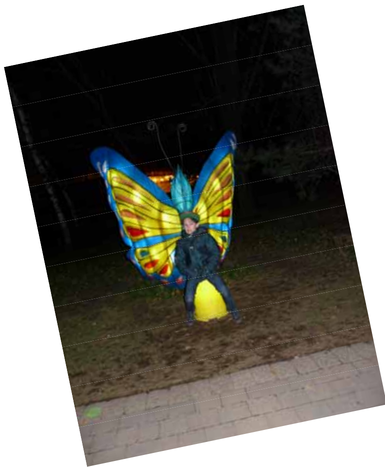
Yohan aux lanternes chinoises (2010)